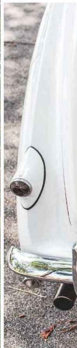
Studio 33 Weddings - Ivan Franchet